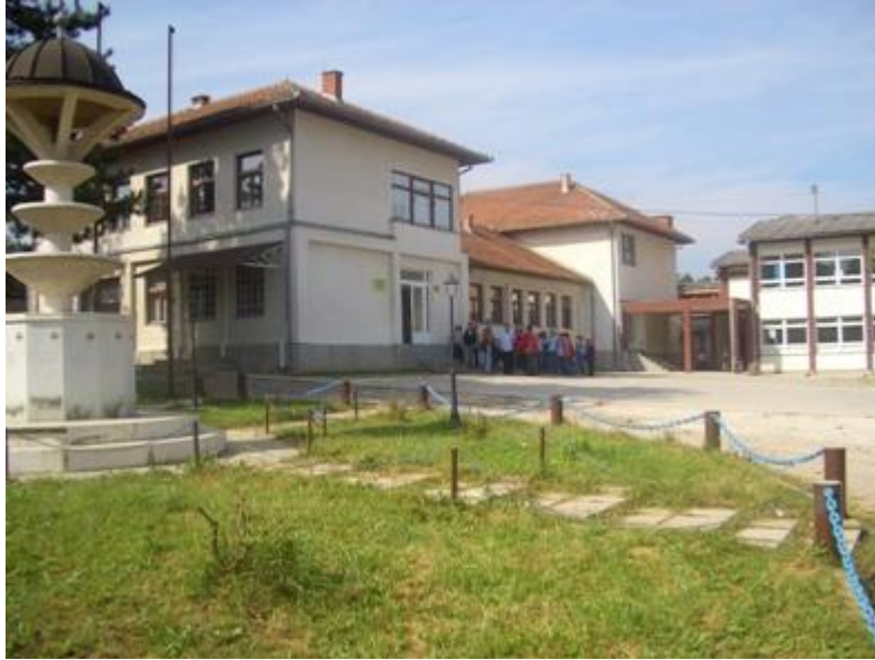
Slika 1. J.U.O.Š. „Bašigovci“ u Bašigovcima

U aprilu 2004. godine usvojen novi Zakon o osnovnom odgoju i obrazovanju. Reforma odgojno – obrazovnog sistema obuhvata : devetogodišnje obrazovanje, inkluzivno obrazovanje.